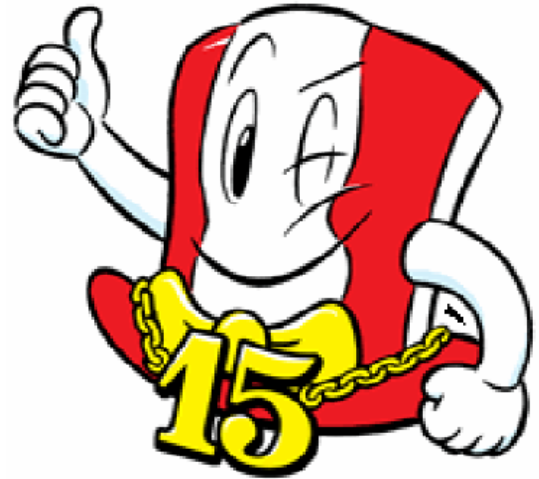
gezelligheid kent geen tijd