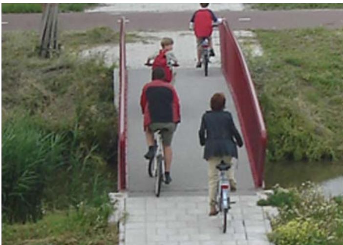
zo dus NIET!!!

Veel bewoners ergeren zich aan het fietsen op de stoep, maar vooral door het gras. Veel voetpaden hebben hekjes om het fietsen wat moeilijker te maken, dus er maar omheen, wat tot gevolg heeft dat op die plaatsen het er niet uit ziet. Tijdwinst om af te snijden is vaak gering, maar de ergernis des te groter. De weg is voor de auto, brommers en fietser, fietspaden voor fietsers en de voetpaden voor de voetganger. Zonder elkaar in de weg te zitten hebben we in onze wijk van al die mogelijkheden er genoeg.