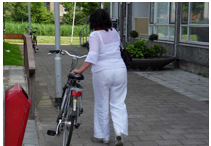
het goede voorbeeld