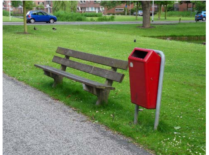
vernien kost veel geld