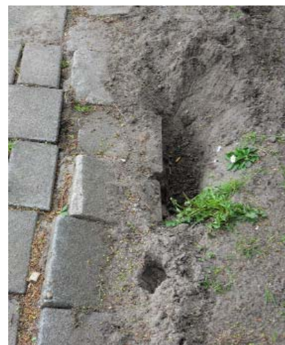
komt tijd.....komt straat