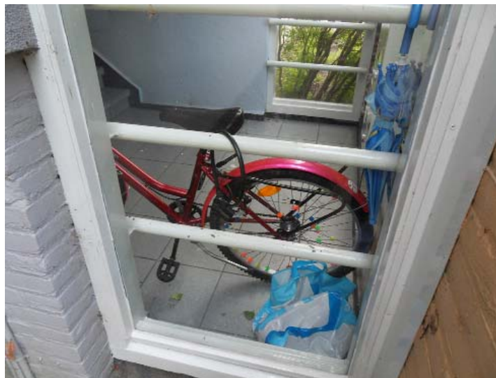
een schoon portiek is een veilig portiek